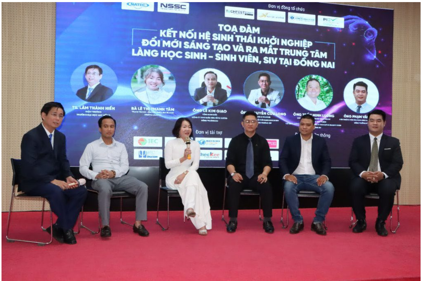
Giới thiệu các dự án khởi nghiệp cùng sinh viên tại Đồng Nai