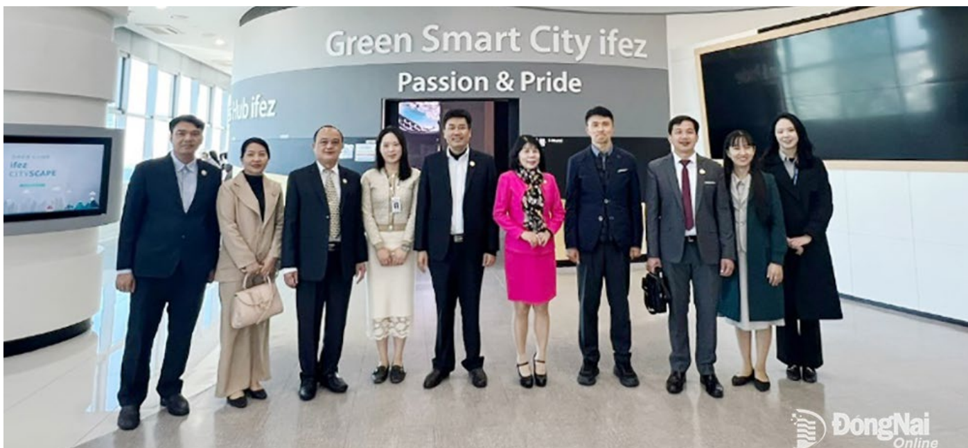
Đoàn công tác của Đông Nai chụp hình lưu niệm tại Trung tâm Xúc tiến Khu Kinh tế tự do Incheon

hành xây dựng TP. Incheon: Trung tâm Xúc tiến Khu Kinh tế tự do Incheon; Trung tâm điều hành thành phố thông minh và Trung tâm kinh tế Sáng tạo và Đổi mới Incheon. Tại đây, đoàn đã được chia sẻ kinh nghiệm và tham quan thực tế hoạt động điều hành của các trung tâm trong hoạt động xây dựng, quản lý, vận hành cũng như những chính sách thu hút phát triển kinh tế TP. Incheon.