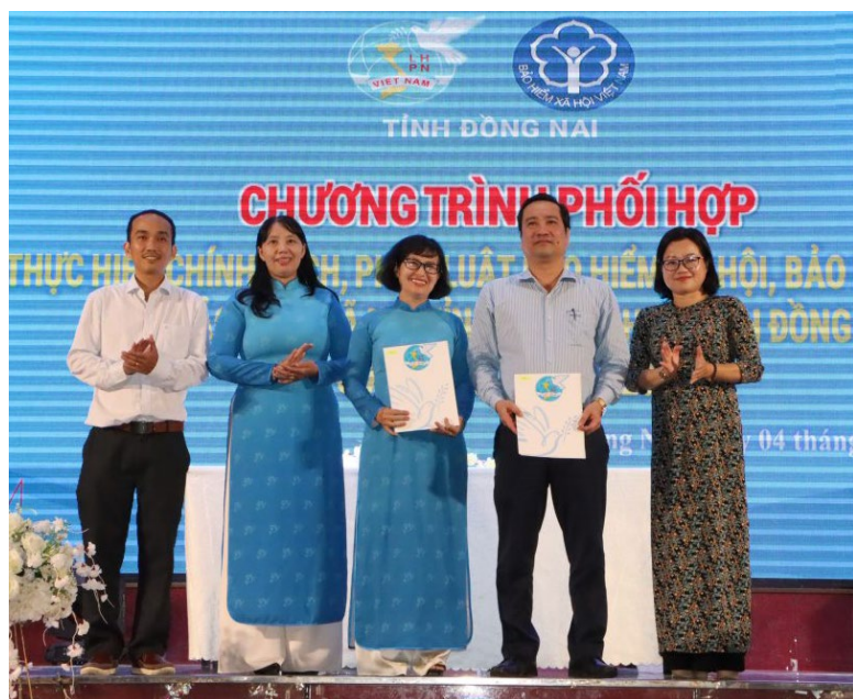
Hội LHPN Đồng Nai ký kết hợp tác với các đơn vị

gia xây dựng Đảng, hệ thống chính trị; nâng cao chất lượng thực hiện phong trào thi đua, cuộc vận động, góp phần thực hiện thắng lợi các nhiệm vụ chính trị của địa phương, đơn vị; các cấp Hội sẽ tiếp tục có nhiều hoạt động hiệu quả, thiết thực, hỗ trợ phụ nữ khởi nghiệp, phát triển sản xuất, kinh doanh, góp phần nuôi dưỡng niềm đam mê, khát vọng khởi nghiệp sáng tạo, cống hiến vào sự phát triển của quê hương, đất nước... góp phần thể hiện được năng lực, bản lĩnh của phụ nữ trong thời đại mới.