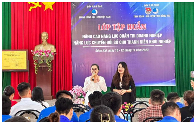
Quang cảnh lớp tập huấn