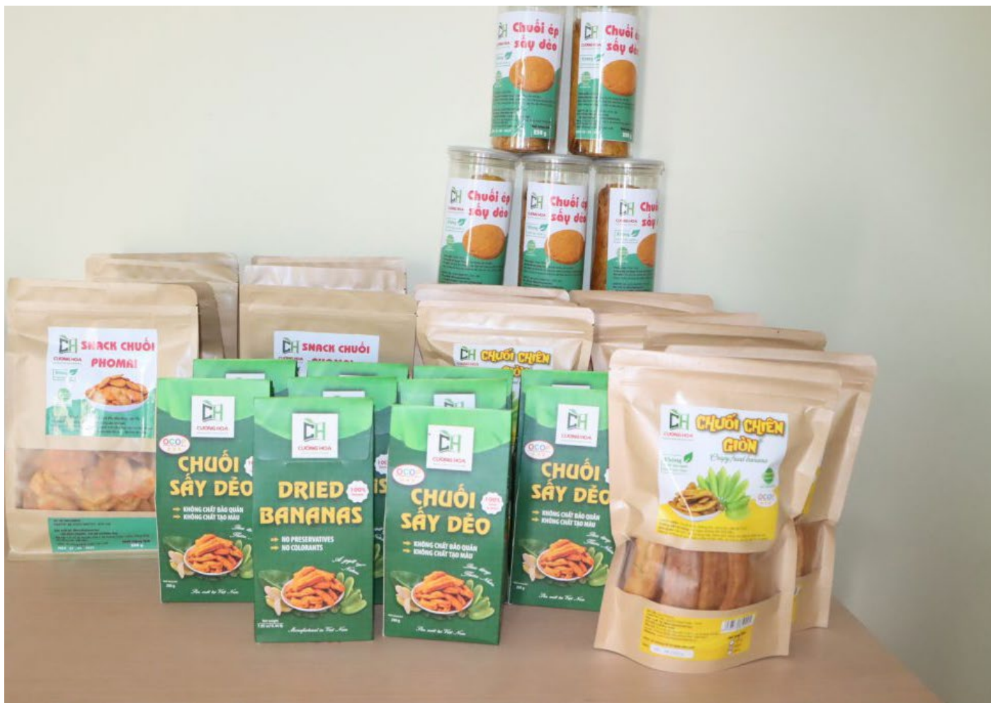
Sản phẩm dự án khởi nghiệp do phụ nữ làm chủ tại Đồng Nai

ra các sản phẩm, dịch vụ độc đáo, có giá trị thương mại cao, đáp ứng yêu cầu thị trường trong nước và xuất khẩu.