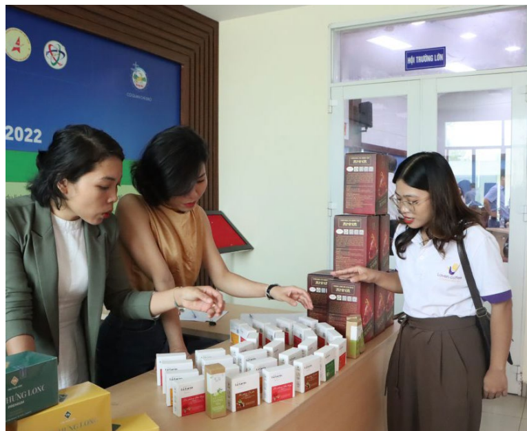
Phụ nữ huyện Vĩnh Cửu giới thiệu sản phẩm khởi nghiệp

T heo Hội Liên hiệp phụ nữ tỉnh, qua 6 năm triển khai Đề án 939 về hỗ trợ phụ nữ khởi nghiệp, được sự quan tâm, tạo điều kiện của Chính phủ, sự hỗ trợ của các địa phương, các bộ ngành và sự cố gắng, nỗ lực bền bỉ của Hội Liên hiệp phụ nữ các cấp, đã có trên 80.000 ý tưởng kinh doanh của phụ nữ được hỗ trợ; trên 70.000 phụ nữ mạnh dạn khởi sự kinh doanh, khởi nghiệp; gần 5.000 tổ hợp tác/hợp tác xã do phụ nữ quản lý được thành lập; hơn 60.000 doanh nghiệp của phụ nữ mới thành lập được tư vấn nâng cao năng lực, hỗ trợ kết nối các nguồn lực để phát triển.