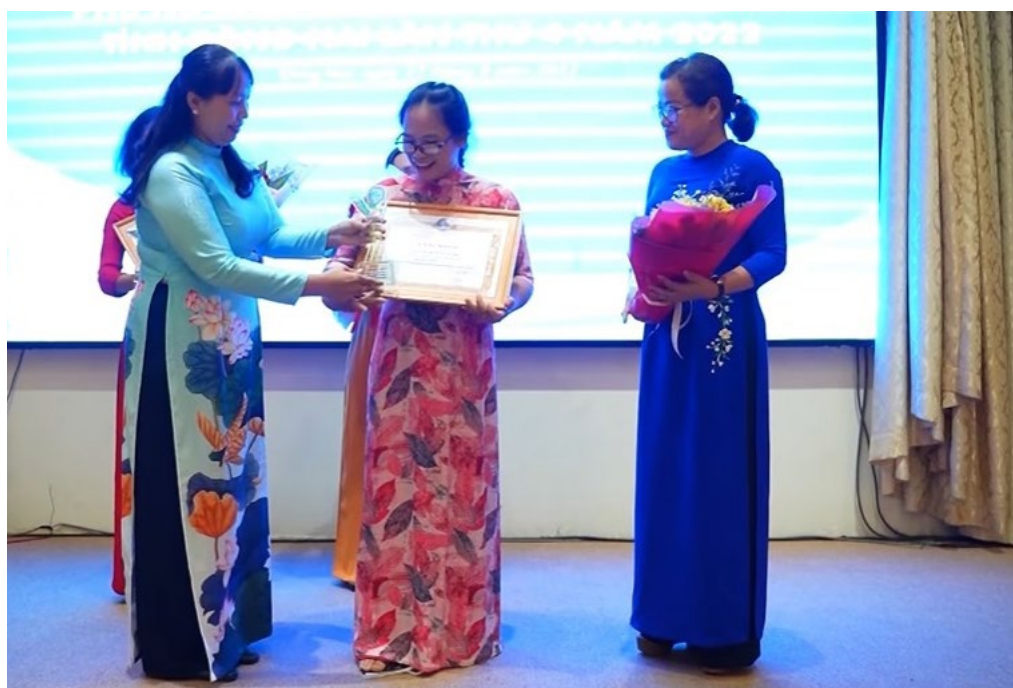
Dự án Bọt ngũ cốc Yến Lộc rừng đạt giải cuộc thi phụ nữ Đồng Nai khởi nghiệp

Dự kiến, trong tương lai, dự án sẽ đầu tư vào nghiên cứu và phát triển để cải tiến sản phẩm và đầu tư cho du lịch trải nghiệm vườn rừng sương sâm.