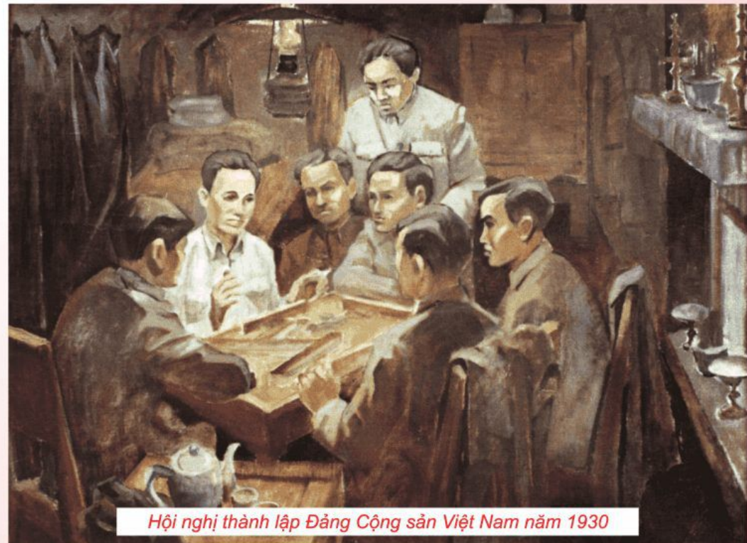
Hội nghị thành lập Đảng Cộng sản Việt Nam năm 1930

Đảng Cộng sản Việt Nam ra đời đã phản ánh sự kết hợp giữa đấu tranh giai cấp và đấu tranh dân tộc ở nước ta trong những năm đầu thế kỷ XX; là sản phẩm của sự kết hợp giữa chủ nghĩa Mác-Lênin, tư tưởng Hồ Chí Minh với phong trào công nhân và phong trào yêu nước Việt Nam; là bước ngoặt trọng đại trong lịch sử cách mạng Việt Nam.